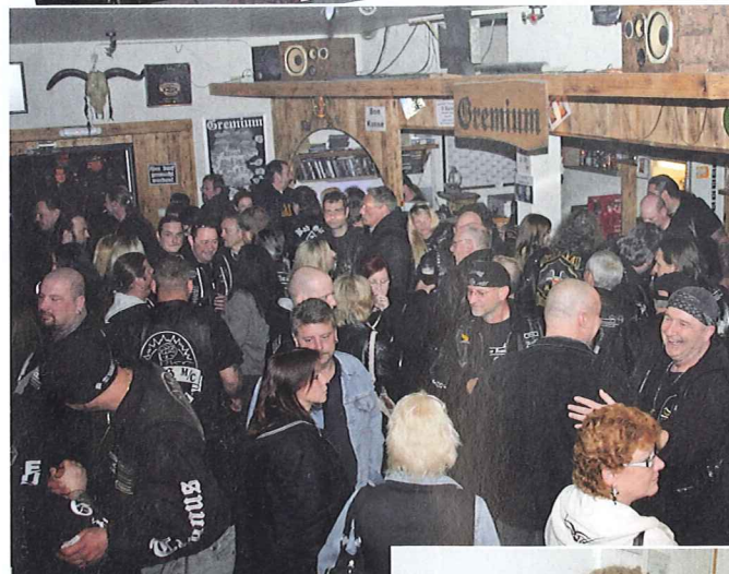
Starker Andrang: Die Gäste soffen das Clubhaus bis auf zwei Kästen Bier leer