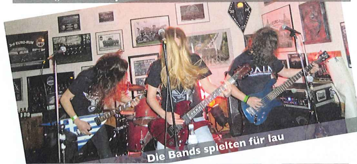
Die Bands spielten für lau